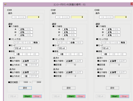
T-ADPNEZ (オプションアダプタ)