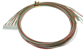
出力用オプションケーブル T-CVPH12010 (8chの場合は2本必要です)