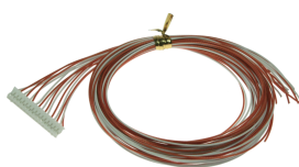
オプションケーブル T-CVPH16010