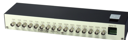
BNC対応入出力用アダプタ(ケーブル付) T-ADP02C 税別価格25,000円